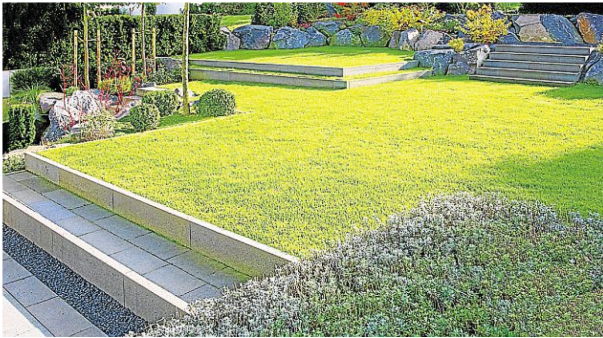
Ein „grünes Zimmer“, in Szene gesetzt vom flämischen Gartenarchitekten Peter Wirtz (Bild oben). Die Bilder in der Mitte und unten zeigen Arbeiten von Peter Berg – Beispiele für eine Inszenierung mit Licht, Wasser und Grün (Mitte) sowie für geschickte Terrassierung einer Gartenfläche mit Stufen und Felsen.

mer vor allem durch die Form, nicht durch üppige Blumenrabatten und vor allem nicht durch eine fast erschlagende Buntheit. Geometrie und Grün sind die Erkennungszeichen dieser Gartenkunst – und ihren Reiz haben sie nie eingebüßt.