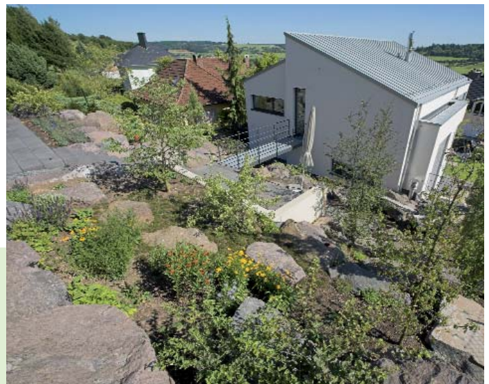
Die Befestigung dieses steilen Gartengrundstückes gelang Berg hauptsächlich durch die Basaltfelsen zusammen mit wenig Sichtbetonmauern.

Bei diesem Objekt sind Fassade und Außenraum inklusive Beleuchtung perfekt aufeinander abgestimmt. Die Lichtplanung stammt von Fritz Döpfer, LUC, www.lichtundcreatives.de .